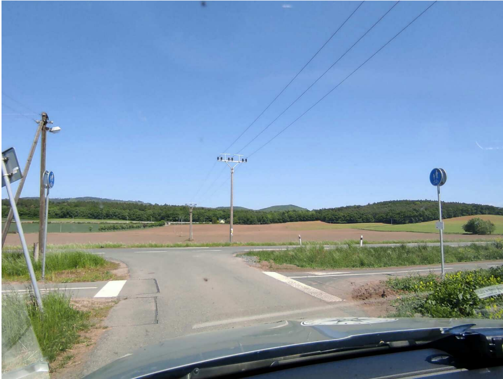
Ukončení stezky v zastavěném území